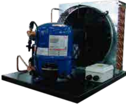
Unidad Condensadora Friober