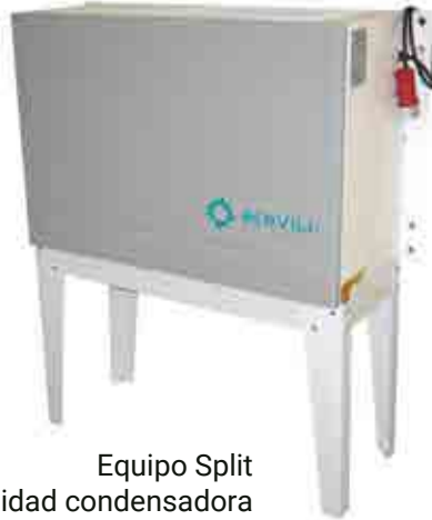
Equipo Split Unidad condensadora MT70 / MT90 / BT65