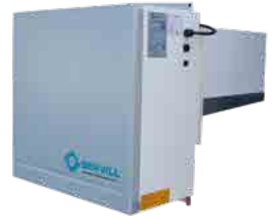
Equipo Compacto BMT 20