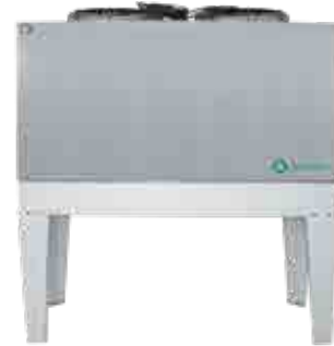
Unidad condensadora BMT 400