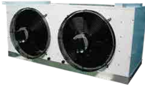
Unidad Interior Evaporadora BMT 400 / BBT 400